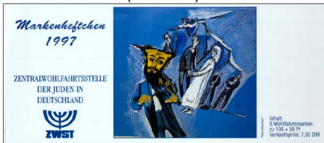
dünnere, glänzender Karton