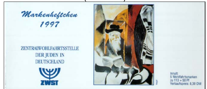
dünnere, glänzender Karton