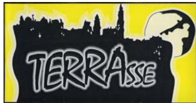
1. DS -