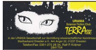
4. DS -