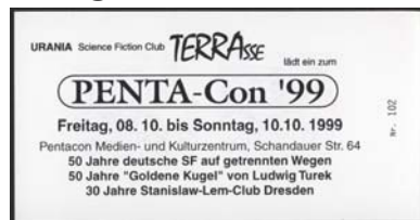
2. DS -