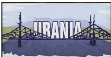
1. DS -