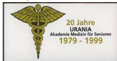
4. DS -