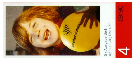
dünn, glatter Hochglanzkarton