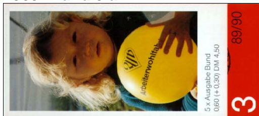
dünn, glatter Hochglanzkarton