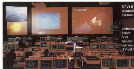
4. DS -