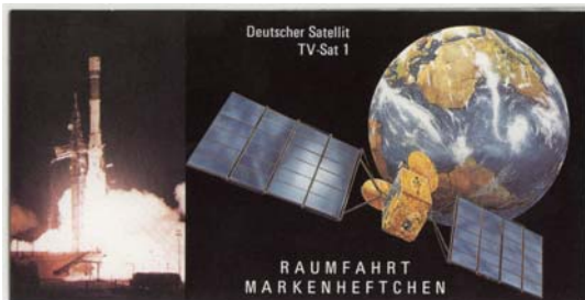
1. DS -